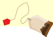
Fusy po kawie i herbacie